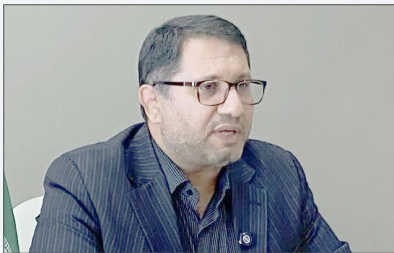
مؤثری در اجرای برنامه ها داشته اند.

همگانی در استان کرمان با قدرت ادامه خواهد داشت و سال ۱۴۰۵ را باید سالی ویژه برای توسعه همزمان ورزش همگانی و قهرمانی در کرمان دانست.