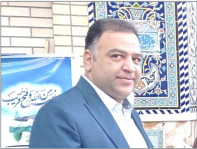
میراث فرهنگی، گردشگری و صنایع دستی استان کرمان را بر عهده داشت.

و حفظ بناهای تاریخی پایگاه‌ها و موزه‌ها اهتمام لازم را به عمل آورد.