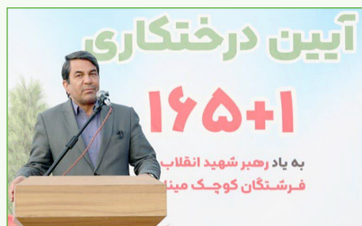
به یاد رهبر شهید انقلاب فرشتگان کوچک میناب

راهپیمایی‌ها، تشییع شهید و مراسمی که در رثای رهبر شهید و اعلام بیعت با مقام معظم رهبری حضرت آیت‌الله سیدمجتبی خامنه‌ای برگزار شد، ابراز رضایت شد. وی گفت: در تماس‌های پیشین وزیر کشور و دیگر مقامات کشوری نیز حضور مردم کرمان در صحنه و مشارکت آنان در برنامه‌های مختلف مورد تأکید قرار گرفت.