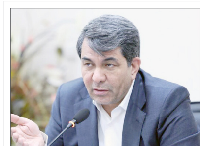
استاندار کرمان از تشکیل و برگزاری کارگروه «صدای مردم»

بر اساس رویکرد دولت برای شنیدن و رسیدگی به نظرات، دیدگاه‌ها، انتقادات و اعتراضات مردم در موضوعات مختلف خبر خبر داد. به گزارش روابط عمومی استانداری کرمان، دومین جلسه کارگروه «صدای مردم» به ریاست دکتر محمدعلی طالبی استاندار کرمان و با حضور مدیرکل دفتر مدیریت عملکرد، بازرسی، امور حقوقی و ارتباطات مردمی استانداری کرمان و مدیران مرتبط برگزار شد. استاندار کرمان در حاشیه این نشست گفت: با رویکردی که دولت برای توجه به مطالبات و شنیدن صدای مردم دارد، این کارگروه با مسئولیت استاندار و حضور مدیران زیرمجموعه تشکیل شده و مأموریت اصلی آن رصد