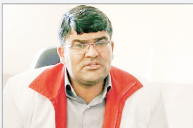
رایگان ارائه شده است.

ویزیت شدند و ۹۳۰۷ نفر دارو دریافت کردند. فلاح در ادامه با اشاره به اعزام ۲۹ بیمار توسط آمبولانس این درمانگاه به بیمارستان‌های مختلف در نجف اشرف بیان کرد: هم چنین ۲۹۷۶ نفر خدمات پیراپزشکی از قبیل تزریقات، پانسمان و بانداژ، تست اندازه‌گیری قند و فشار خون دریافت کردند.